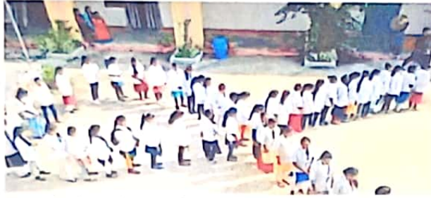
बोडला. रेड रिबन की आकृति में बनाई मानव शृंखला।

उन्होंने छात्रों से हमेशा जागरूक रहने का आह्वान किया। एड्स दिवस पर राष्ट्रीय सेवा योजना, विज्ञान संकाय, समाजशास्त्र विभाग द्वारा निबंध